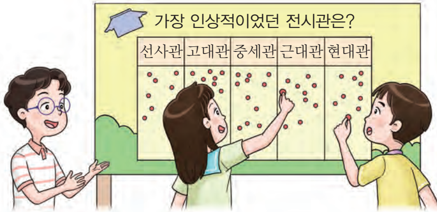
전시관별 학생 수

슬기네 학교 전체 학생은 한국 박물관에 현장 체험 학습을 다녀왔습니다. 슬기는 친구들에게 가장 인상적이었던 전시관을 조사하여 표로 나타냈습니다. 물음에 답해 봅시다.