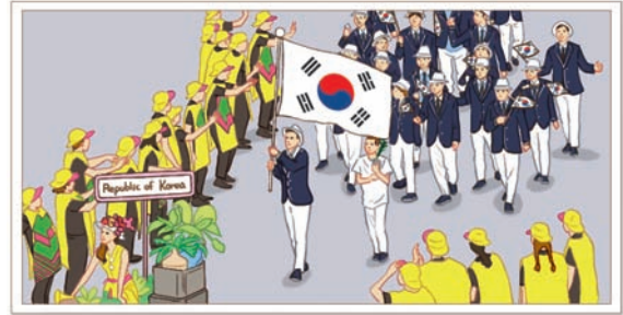
올림픽에 참가한 우리나라 선수 수