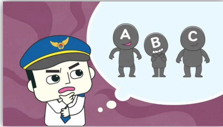
<차시 도입 - 퀴즈형>