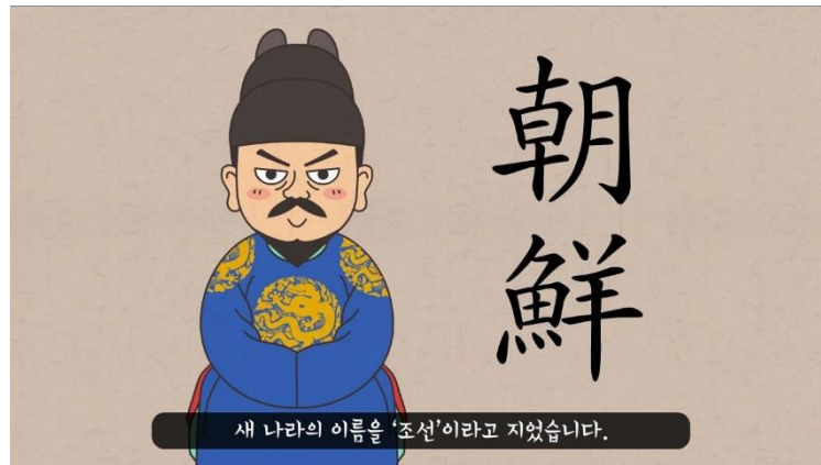
▲ 웹툰 애니메이션 영상 LINK