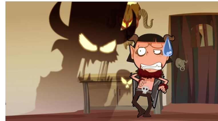
▲ 게임 애니메이션 영상 LINK