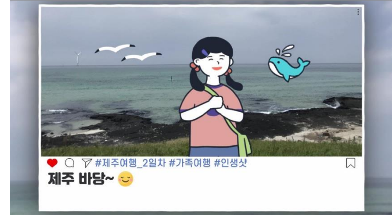
▲ 모션그래픽 영상 LINK