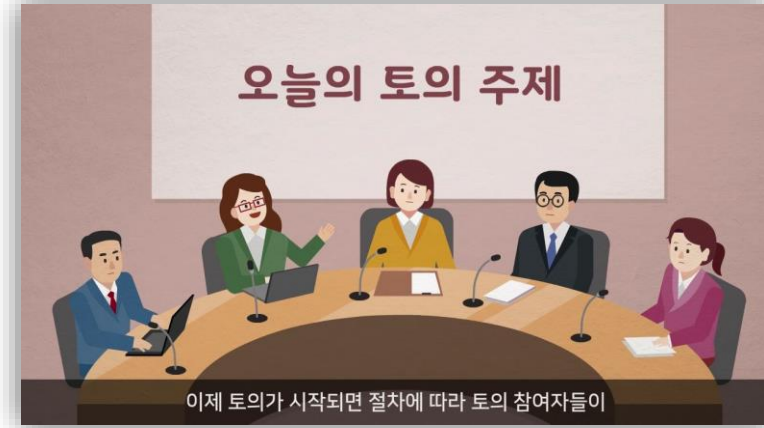
<차시 도입 - 개념형>